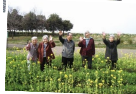
フラワーパークの散歩、四季折々に楽しめます