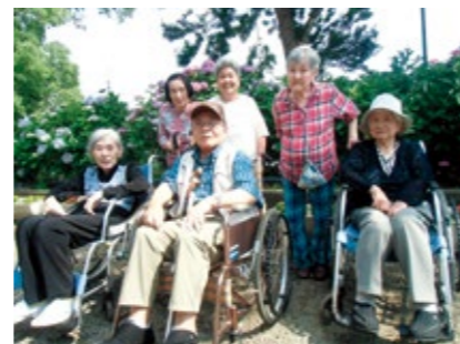
音楽寺へ皆で出かけたいね! 来年も!