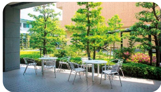
写真:ケアハウスちあき玄関前

社会福祉法人尾張健友福祉会は、地域の多くの方のご支援を受けて2002年に設立し、尾張健友会グ