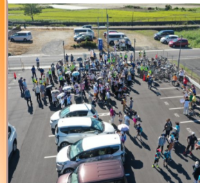
↑ドローンを飛ばして上空から撮影した様子

当日はボランティアの音楽隊による演奏に見送られ、意気揚々とスタートを切りました。晴天の中、計6.5キロのコースを一斉に歩きました。