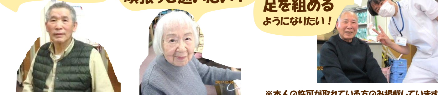
※本人の許可が取得している方のみ掲載しています