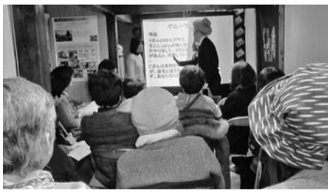
萬葉でのボランティアクラスの様子。次号で紹介いたします

第二部、認知症の方のさまざまな行動に「こんな時あなたならどんな声かけをしますか?」をロールプレイで即興。全員が発表し