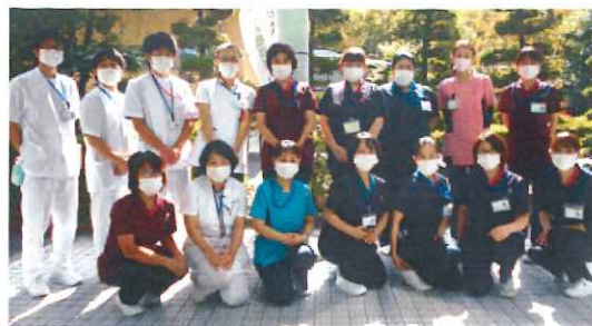
訪問看護ステーション・ちあき