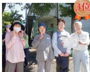
3位 どっこいしょ班チーム