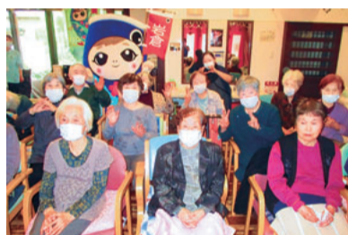
踊って歌って楽しみました

5月1日に岩倉事業所開設15周年を記念として、利用者さんや地域の皆さんも招待し、15周年祭を開催しました。ステージイベントには