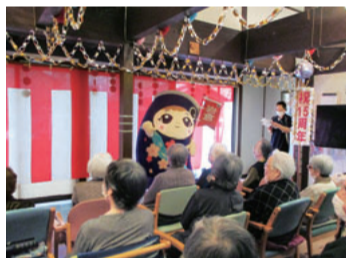
いーわくんが登場

特別ゲストとして岩倉市のマスコット「いーわくん」が登場し、みんなのリノリで踊り、会場を沸かせました。また、ボランティアのA&Kさんの演奏する懐メロソングに合わせてたくさん歌いました。