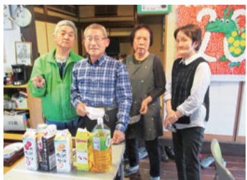
友の会岩倉支部の会員も協力

さん・民生委員さんにもお手伝いしてもらった喫茶コーナーも大好評でした。ほかに、岩倉介護保険サービスセンター・ちあきの介護相談コーナーや尾張健康友サービスの福祉用具の展示なども行ないました。