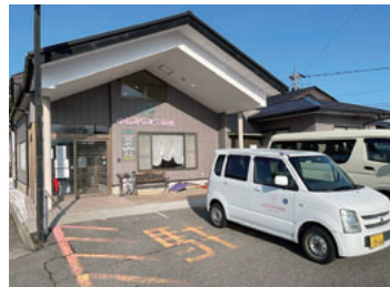
支援に入った小松みなみ診療所

小松みなみ診療所は地震の被害はほとんどなく、近くの粟津温泉に能登から避難された方も来院されています。患者さんの多くは慢性疾患の人ですが、コロナやインフルエンザウイルス感染者も訪れました。11日に診療にあたった人数は午前