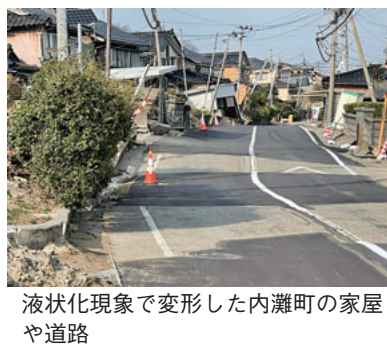
液状化現象で変形した内灘町の家屋や道路

れました。能登地方は崩れた建物が多いのですが、内灘町は液状化現象で土地が隆起して家が傾いたり変形したりしていました。砂も吹き出している、家も建て直せないのではないかと思います。ちなみに、能登はまだ水が出ないそうです（3/14時点）。