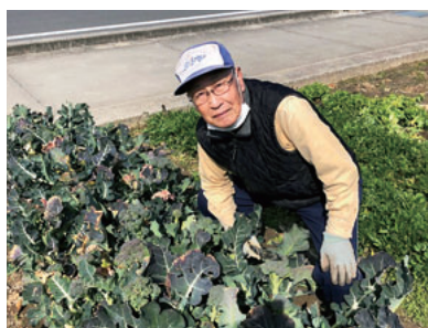
夫が畑で野菜作り

西春町は、合併して北名古屋市になりました。大都市周辺の市なので、我が家の畑は市街化区域にされました。夫は宅地並み課税の49.2㎡の畑で、高い税金を払って野菜や果物などを作っています。雑草との戦いで、空