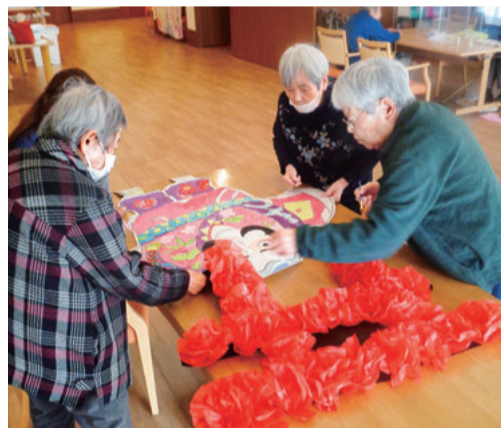
お花で鳥居づくり