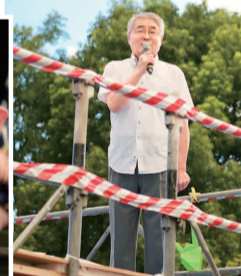
朝井理事長があいさつ