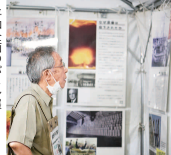
平和企画のパネル展