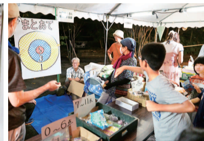
子どもたちが楽しんだまとあて