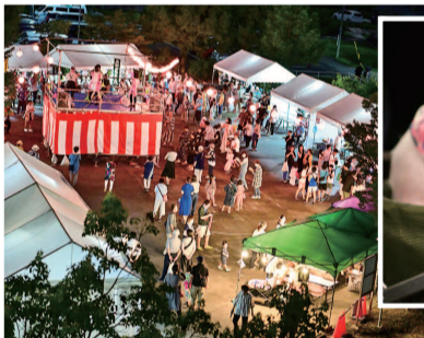
ミニブタも参加しました

「患者さんの過ごし方や看護師の仕事を見て、実際に患者さんがどう使っているかを思い浮かべることができているので、クラークを経験してよかったです。何より、患者さんとの対話が楽しいです」と前を向き、こやかにほえみます。