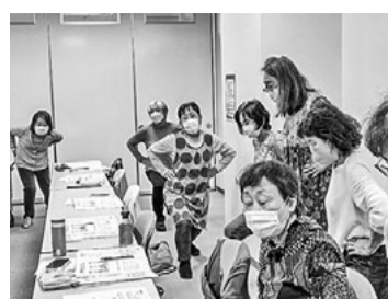
小牧市で口コモ度チェック