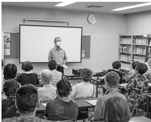
40人以上が参加しました

江南支部は6月17日、鑑賞会を行いました。映画『ぼけますから、よ 』 コロナ対策で開けな