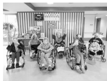
100歳を超えたみなさん