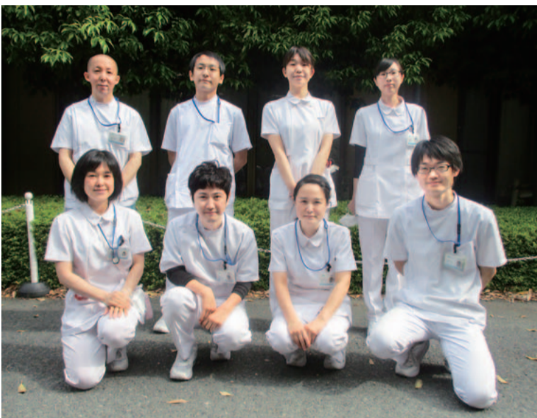
私たちが訪問リハビリを担当します!