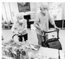
出張売店ひとやすみ でお買い物♪

また、8月は久しぶりに「出張売店ひとやすみ」にて、利用者さんには太鼓や盆踊りに楽しんでもらいました。