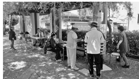
藤棚の下で店開き

丹陽地域を中心に訪問活動始めよう！ 千秋病院の近隣でも、友の会の支部がなく、友の会ニュースが届いていないところがあります。「友の会班会で健康づくりを始めませんか？」と、班会づくりをすすめるため、丹陽地域を中心に訪問を進めています。ご協力をお願いします。