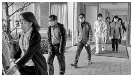
千秋病院の中を一周しました

まず、糖尿病に対する運動の方法や効果について話をした後、実技としてみなさんと一緒に院内のコースで実際にウォーキングを行いました。